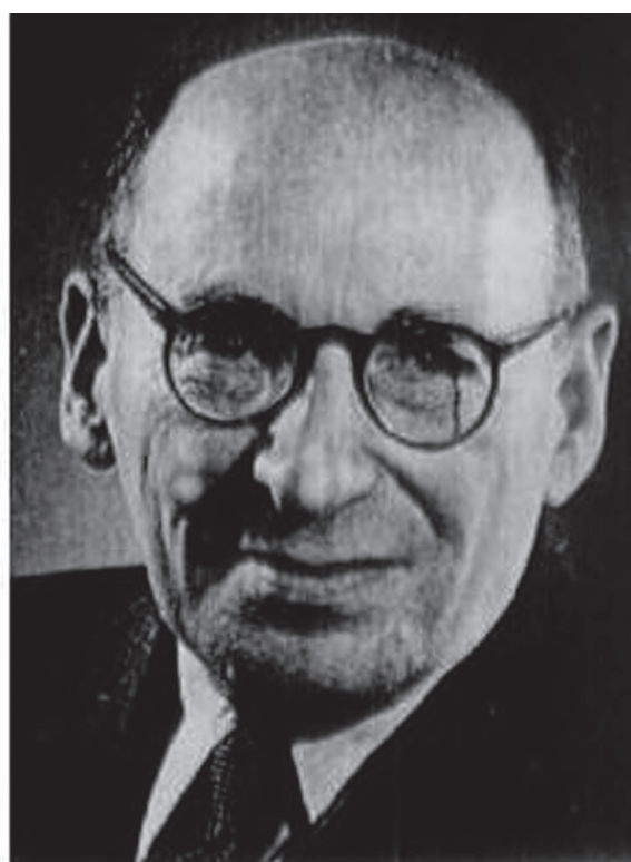
Ludwik Fleck (1896-1961)

Título original: Entstehung und Entwicklung einer wissenschaftlichen Tatsache: Einführung in die Lehre vom Denkstil und Denkkollektiv.