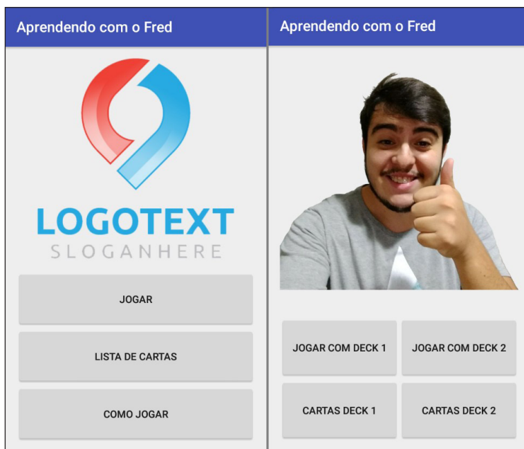
Figura 2: Jogo no Android (Antes e Depois)