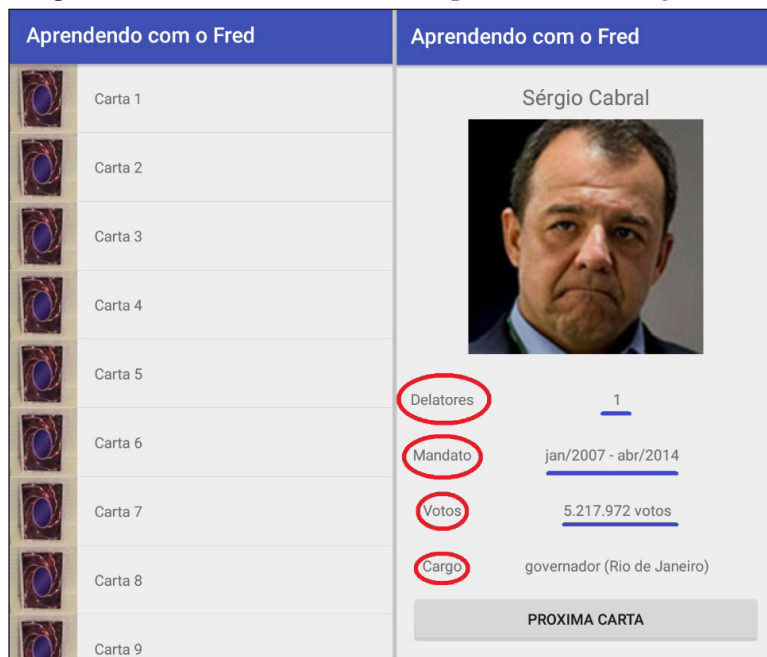
Figura 3: Deck Com as Cartas/Exemplo de Carta do Jogo

Tendo em vista que o jogo ainda está em versão de testes, a contagem de pontos ainda não foi programada pelo sistema. Deste modo, a mesma deverá ser realizada manualmente pelos jogadores. Indica-se, neste momento, que para cada partida, se defina um árbitro, a fim de realizar a contagem de pontos e garantir as regras do jogo por ambas as partes.